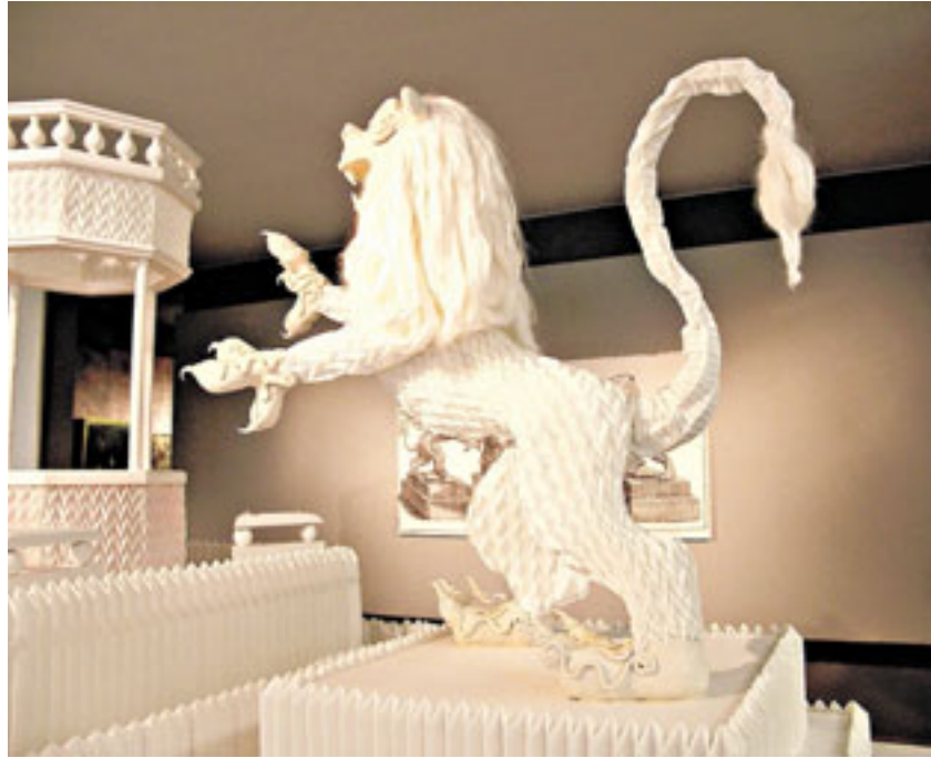
Faltenkunst: Unglaublich, was nur durch die Faltung weißer Tücher entstehen kann, hier ein Ausschnitt aus einem rekonstruierten Tischbrunnen.