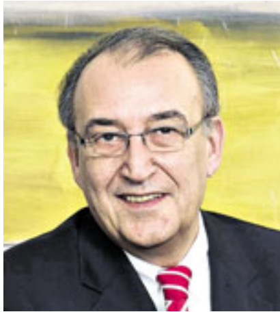
Herbert Napp Bürgermeister der Stadt Neuss

Ob Sushi oder Sauerkraut, Kaubons oder „Kappeswoosch“: Neuss präsentiert sich als Zentrum der Ernährungswirtschaft. Die Ernährungsbranche ist eine der großen Stärken unserer Stadt. Doch in Neuss werden nicht nur hochwertige