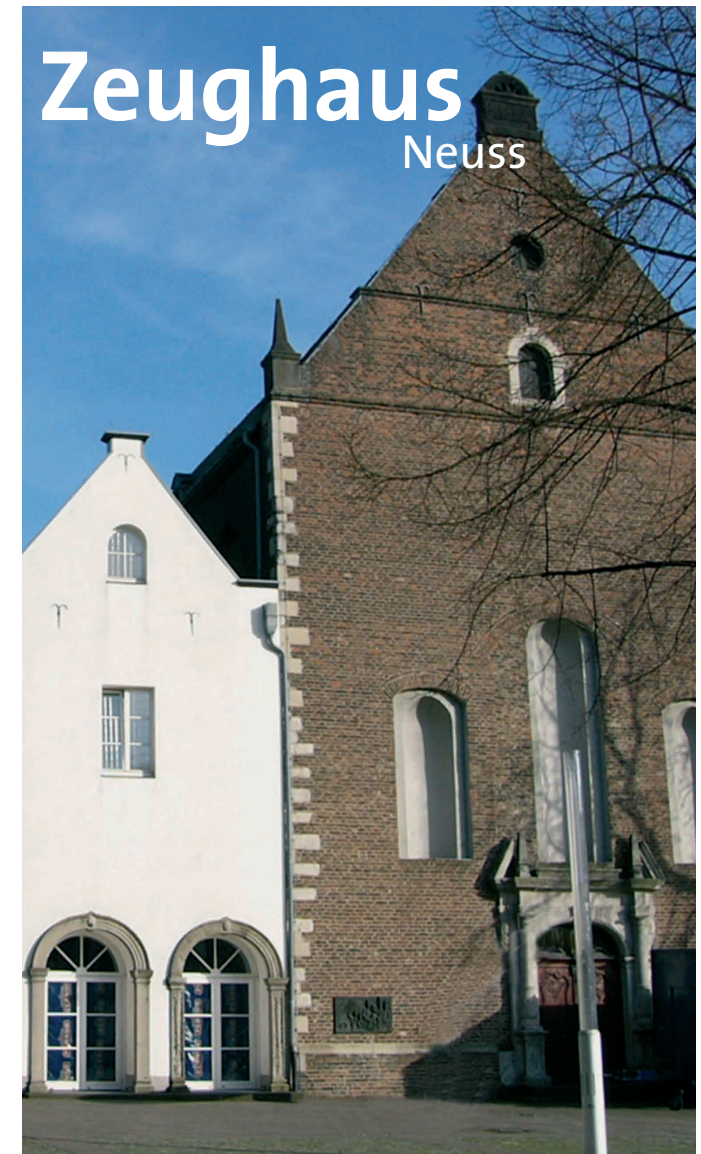
Neuss am Rhein